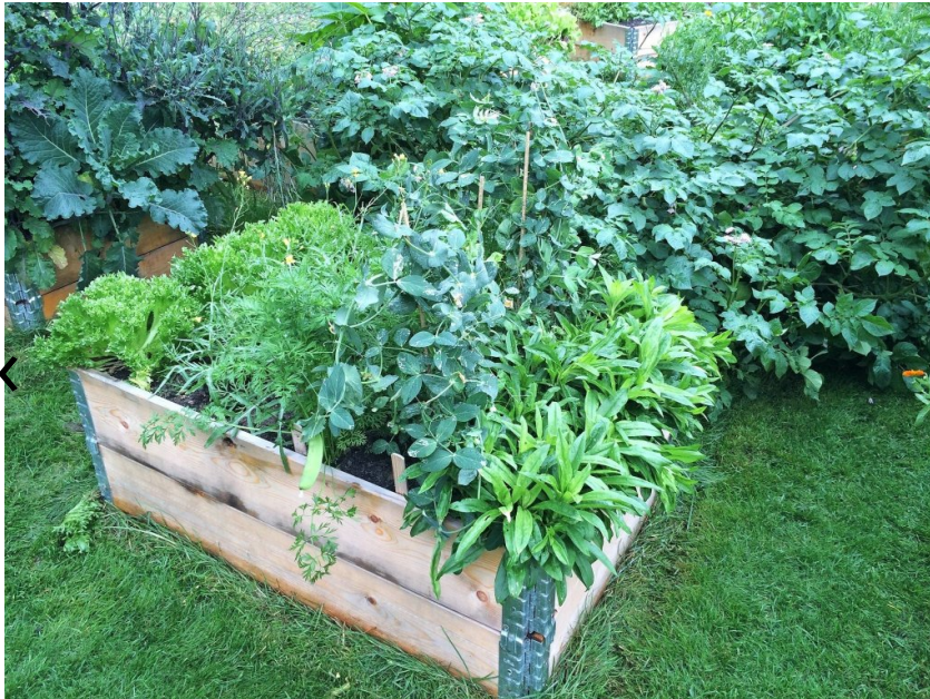
Stadsodling är i fokus under stadsvandringen genom Bagarmossen.